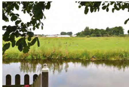
De befaamde 'Ganzenweide'