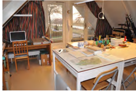
Het atelier van Rob

Het loont vaak de moeite om verschillende boeken tegelijk te bestellen, of samen met andere leden van de gilde te bestellen. Dat scheelt soms aardig in de verzendkosten!